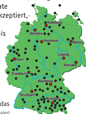
Golfclubverteilung über das gesamte Bundesgebiet (Stand 12/03)

da diese unabhängig vom Deutschen Golf Verband über die Akzeptanz der Platzerlaubnis eigenständig entscheiden können. Hier liegt der Vorteil: Durch Schulungen in kleinen Gruppen können Sie spielend an die deutsche Platzerlaubnis (Hcp 54-37) gelangen, denn in den Grundkursen der SportScheck